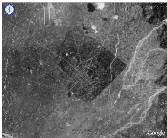
圖 4.3、台中歷史航照影像