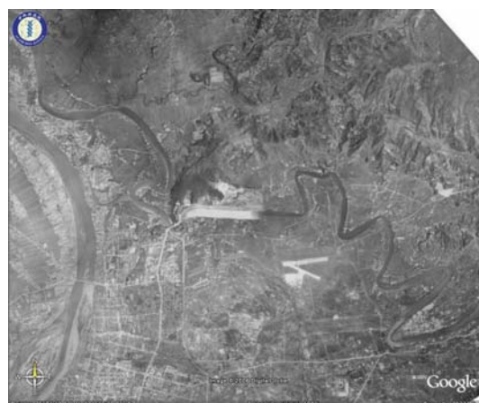
圖 4.2、台北歷史航照影像