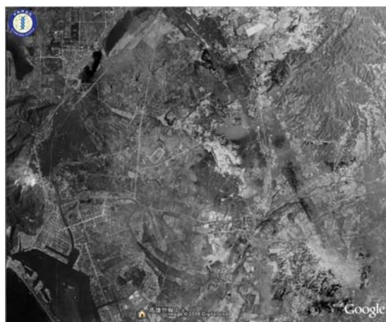
圖 4.4、高雄歷史航照影像