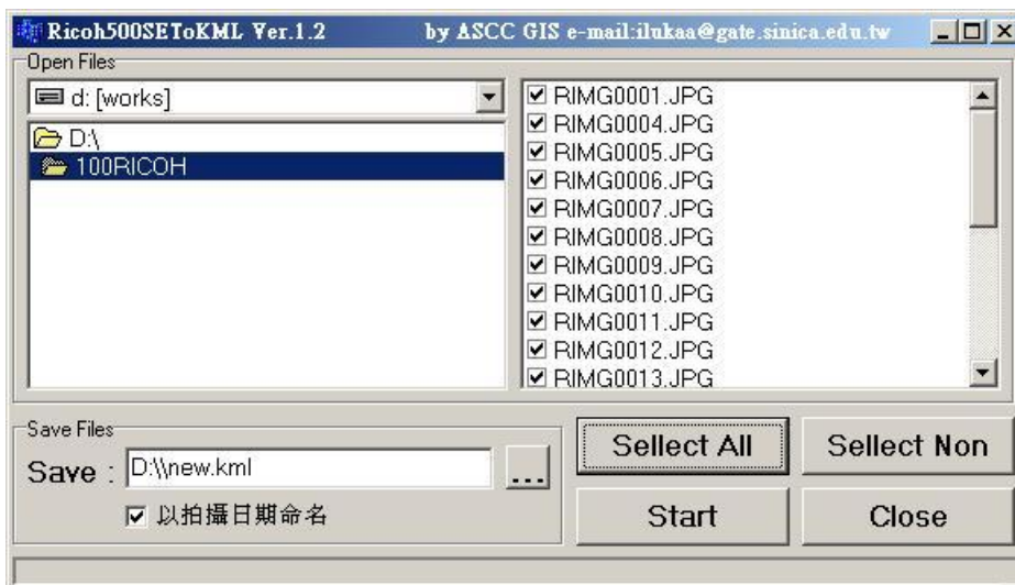
圖二、選擇照片目錄及設定