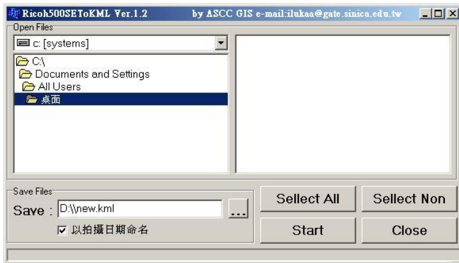
圖一、 Ricoh500se2KML 程式開啟